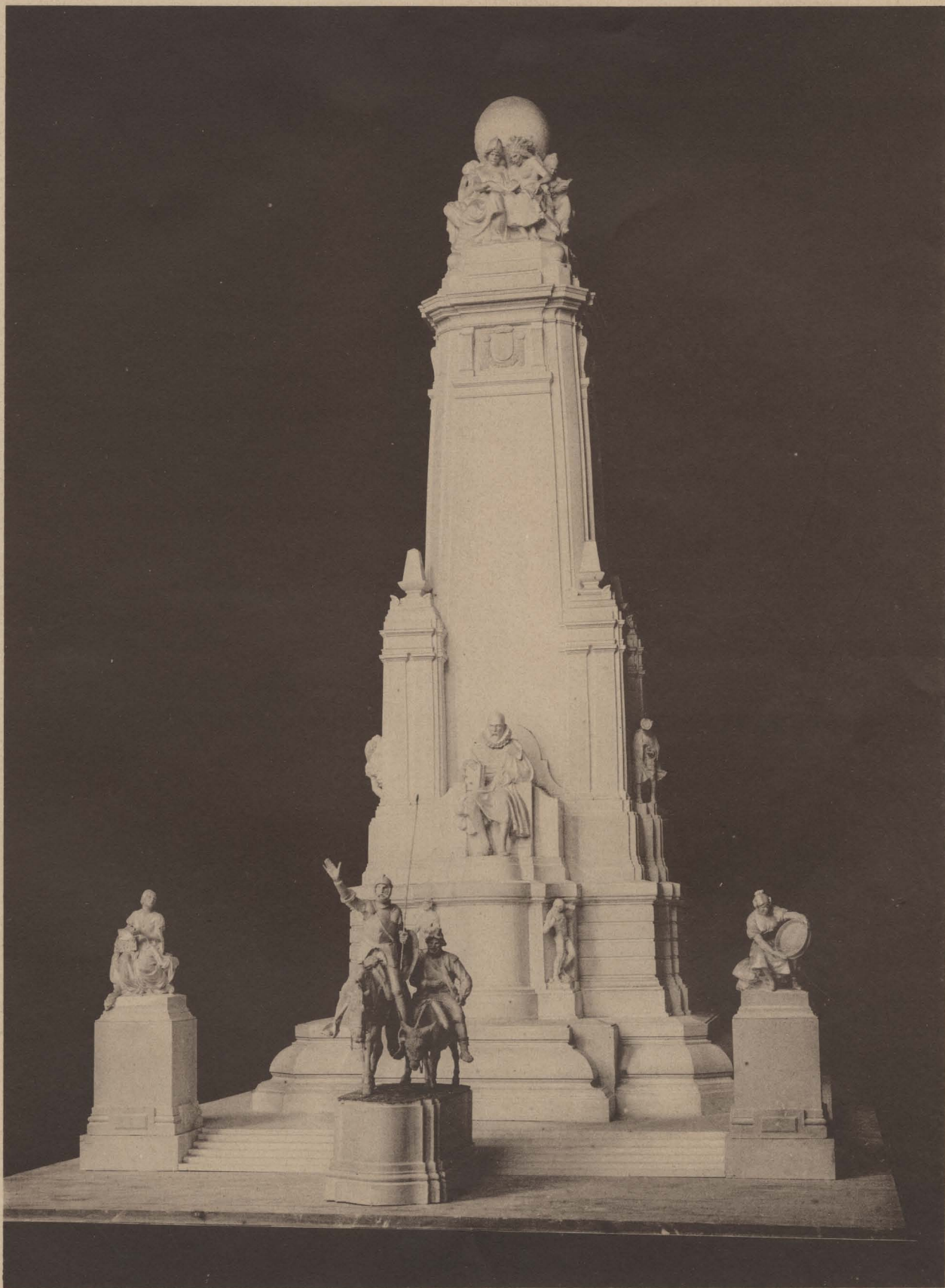
FRENTE DEL MONUMENTO.