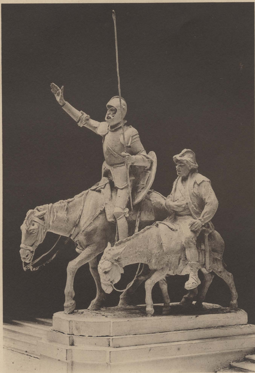
D. QUIJOTE Y SANCHO.