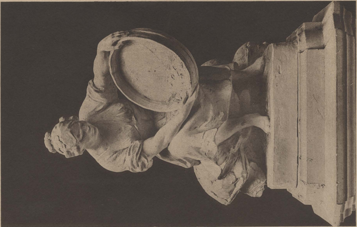
DULCINEA DEL TOBOSO señora de los pensamientos del caballero de la Triste Figura y la imaginada por su escudero.