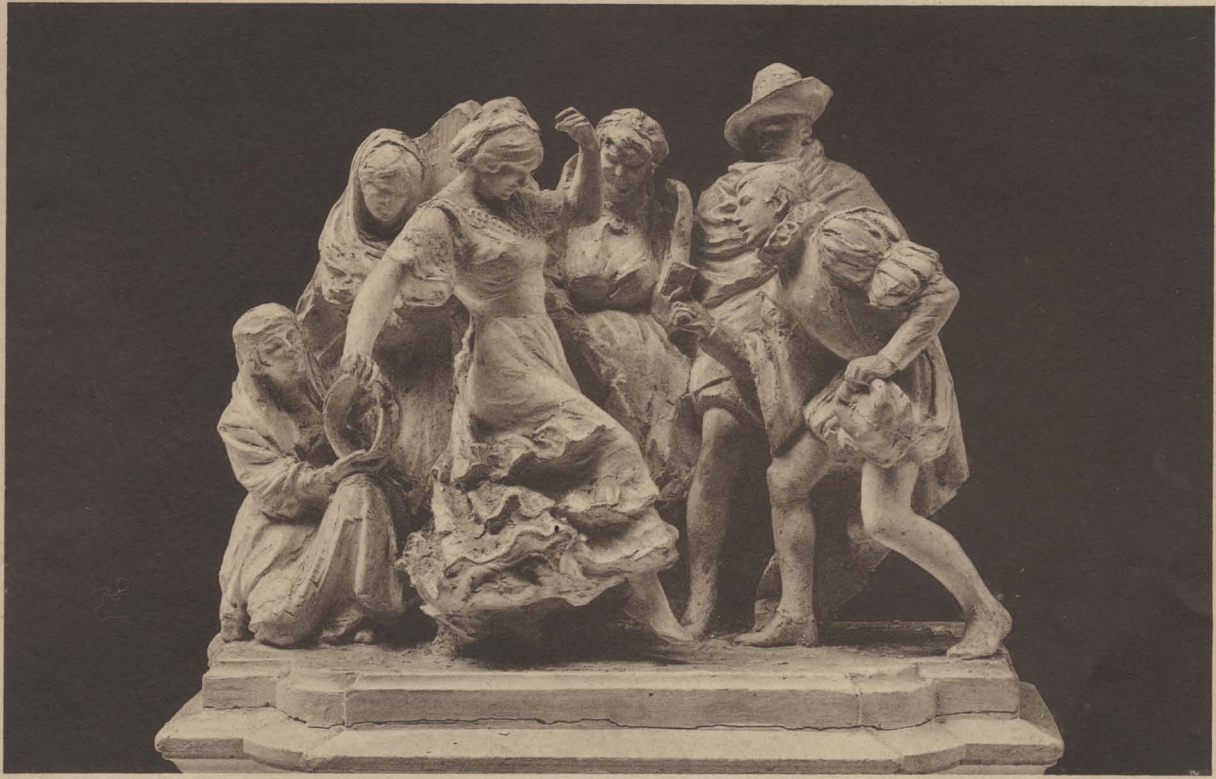
LA GITANILLA Principio de esta NOVELA ejemplar.