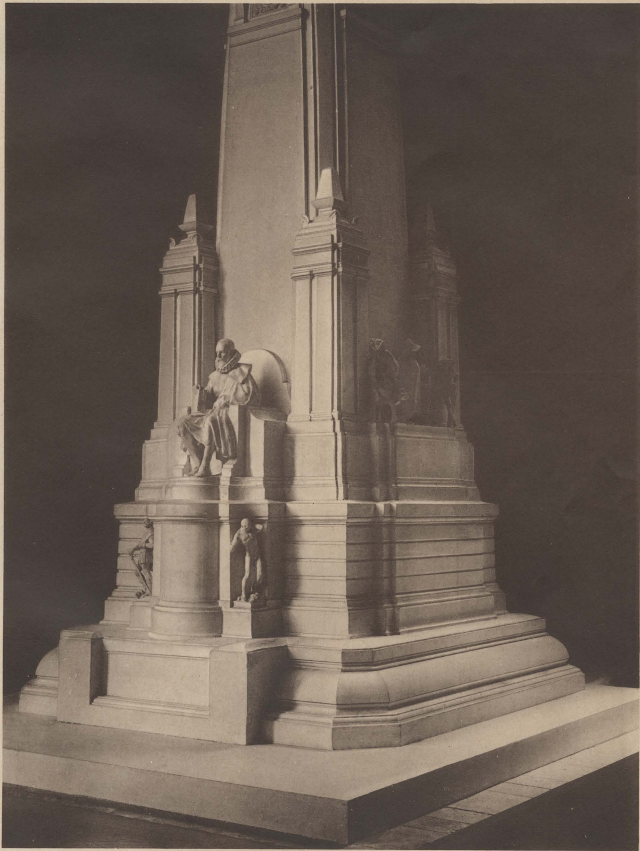
VISTA LATERAL en que se divisa el grupo de Rínconete y Cortadillo.